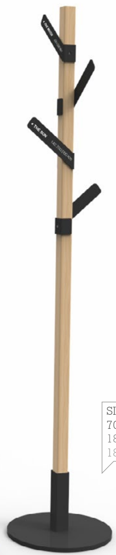
SIE/01 70,2 in. tall 180 cm de altura 180 cm. d'hauteur