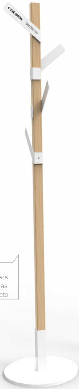
SIE/01 4 hangers 4 perchas 4 crochets