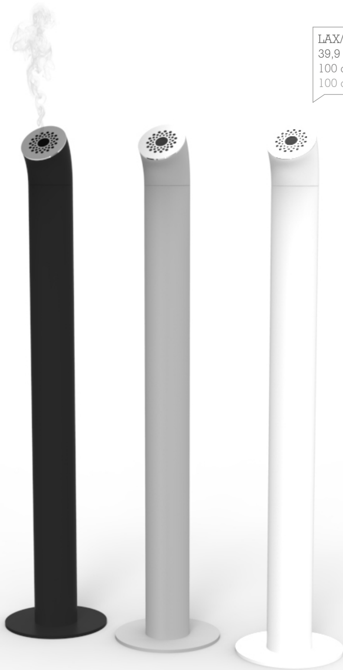
LAX/01 39,9 inches tall. 100 cm de altura. 100 cm de haut.