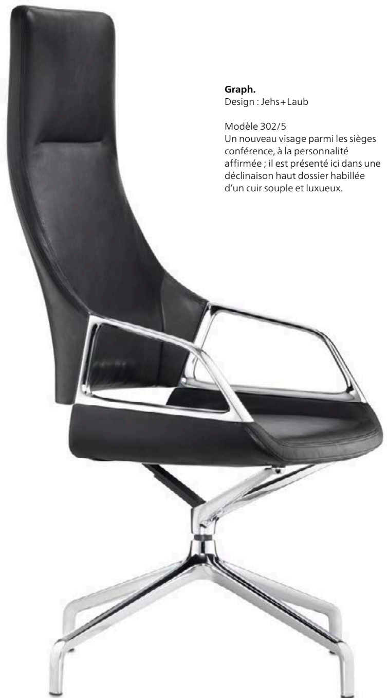
Graph. Design : Jehs+Laub

Sur un tel siège, la qualité du détail va de soi. Elle inclut un montage des accoudoirs sans vis apparentes et un travail très poussé sur les profils et la finition de la structure, sans oublier un habillage aux surpiqûres parfaitement exécutées.