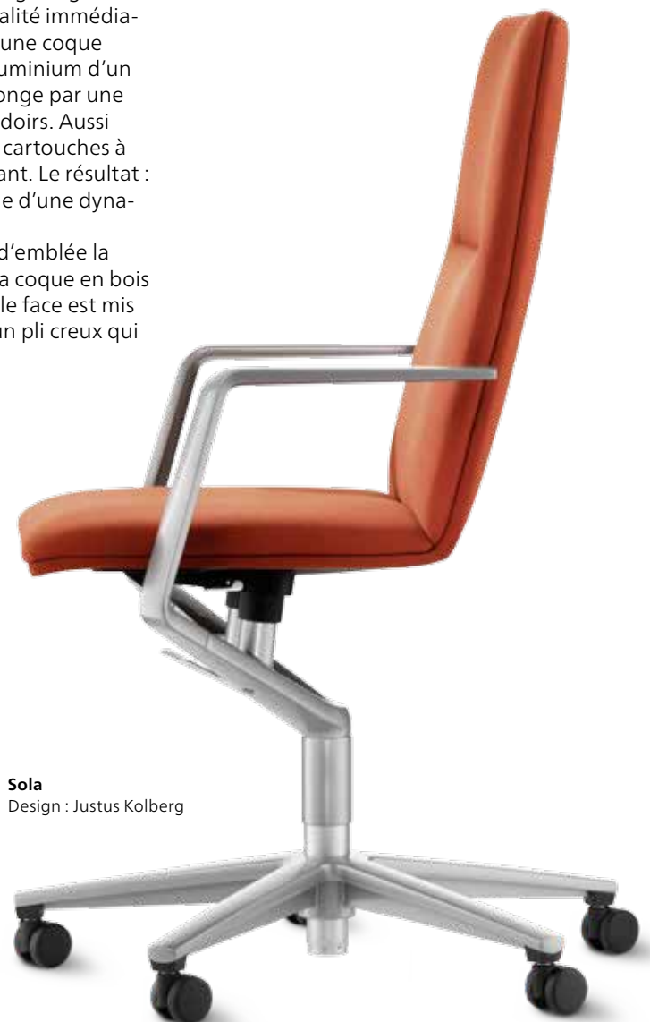
Sola Design : Justus Kolberg

La rigueur du dessin et la suspension apparente expriment d'emblée la qualité du concept et de sa mise en œuvre. En face arrière, la coque en bois moulé reçoit un revêtement ouatiné. Le rembourrage double face est mis en valeur, à la jonction entre face avant et face arrière, par un pli creux qui délimite et affine encore les contours du siège.