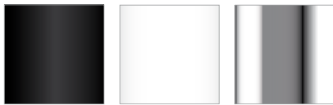
a. b. c.