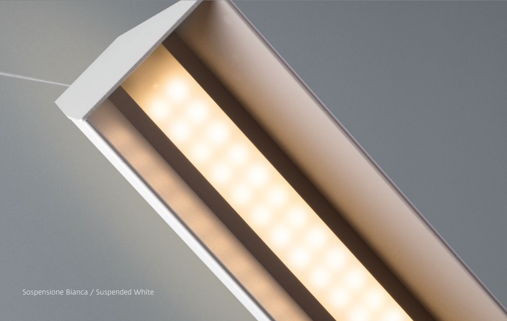
Sospensione Bianca / Suspended White