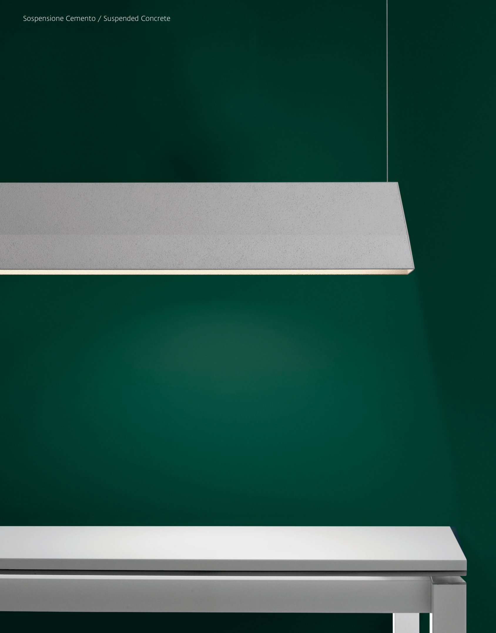
Sospensione Cemento / Suspended Concrete