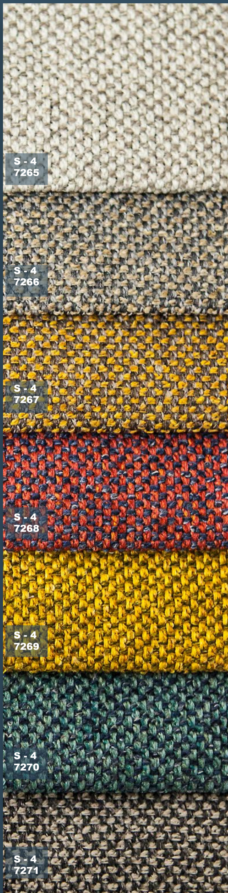
S - 4 7265