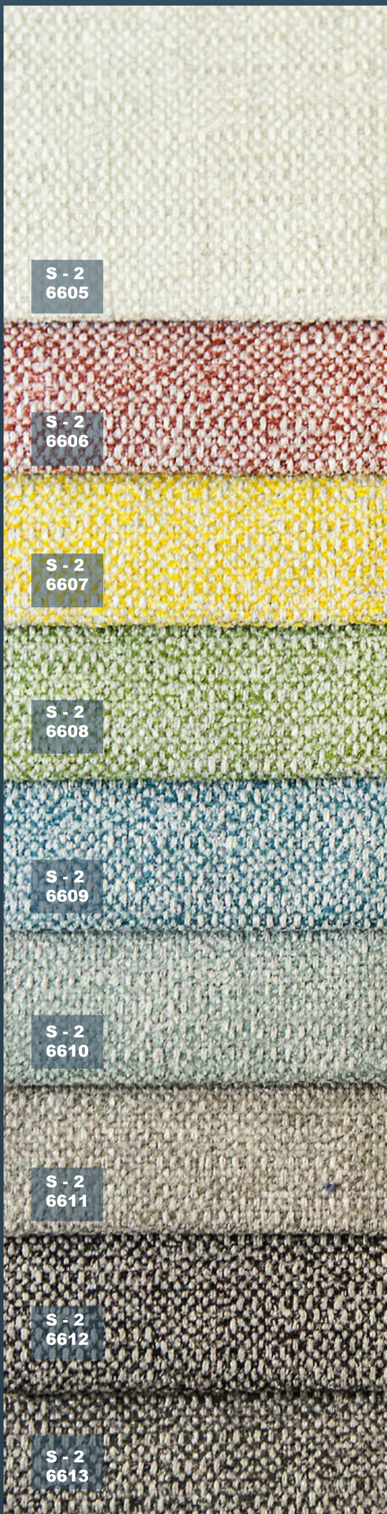
S - 2 6605