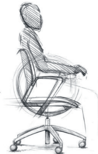
Teekeningen Illustrations: Paolo Fancelli

La Force et le Corps pour les Humans en mouvement. Un siège pivotant est synonyme de mouvement. Sa spécificité réside dans le pivotement et l'oscillation. La forme idéale pour le mouvement, c'est la boule. C'est le seul corps rotatif sans restriction qui conserve toujours une élégance absolue. Même lorsqu'une boule est usinée, réduite par découpage et évidage, la géométrie d'une boule demeure intacte et visible. C'est le cas aussi avec le giroflex 313. La géométrie stricte place l'être humain au centre. Le giroflex 313 est présent, pas dominant. Il est dédié à sa fonction.