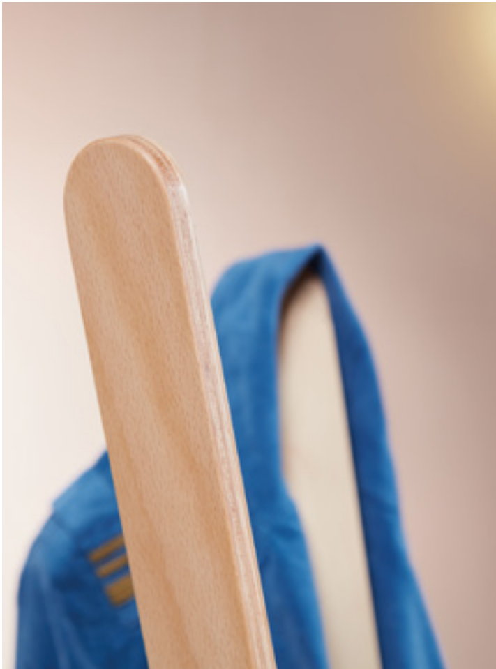
WOODEN SPINE CLOSE UP – MIL 03 WOOD