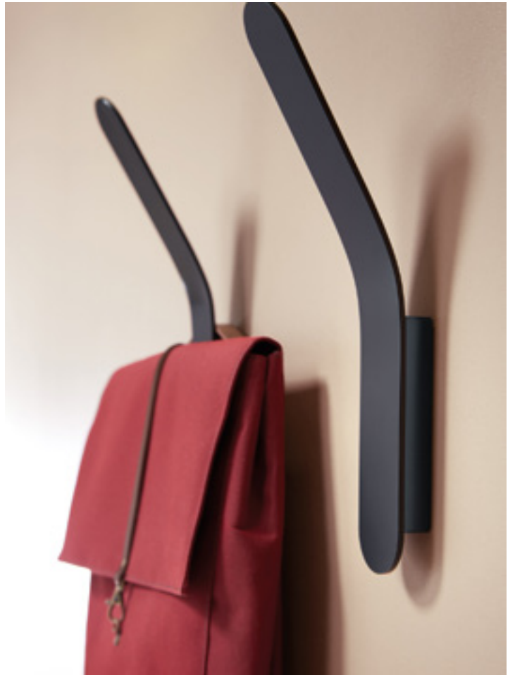
WALL MOUNTED METAL VERSION – MIL 16 7016