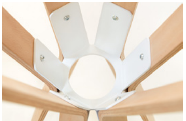
CENTRAL UNIFIER FOR THREE SPINES CLOSE UP — MIL 03 7016 CENTRAL UNIFIER FOR SIX SPINES CLOSE UP — MIL 06 WOOD