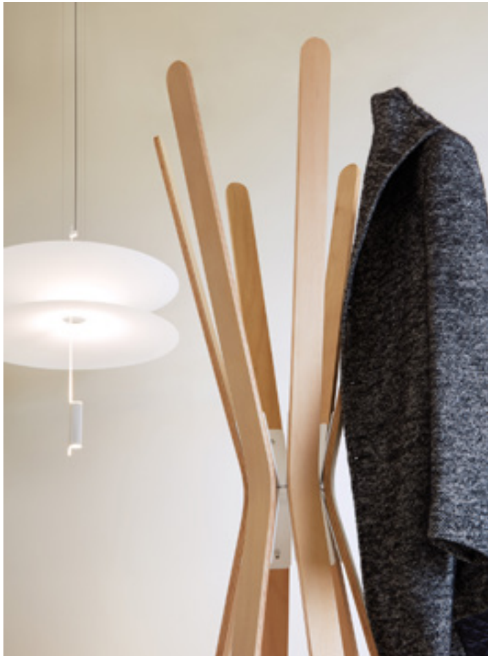
COAT RACK CLOSE UP — MIL 06 WOOD