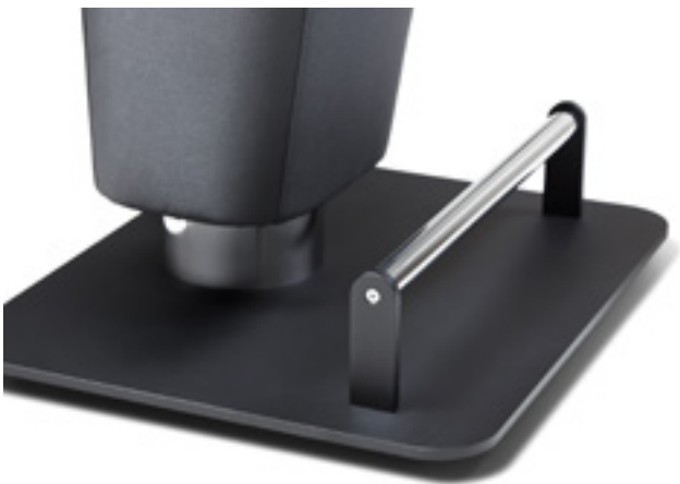
SPACE FOR PLUGS & CONNECTIONS FOOTREST DETAIL