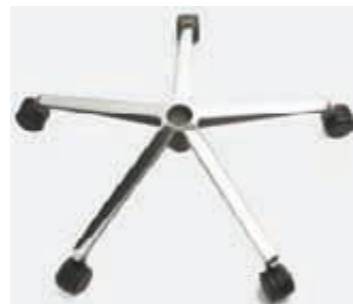
Base piramidal de aluminio pulido Piètement pyramidale aluminium poli Pyramidal aluminium frame