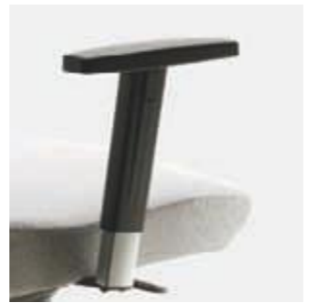
Brazos regulables en altura Accoudoirs réglables en hauteur Height adjustable armrests