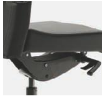
Sistema sincro de luxe Système synchro de luxe Synchro de luxe system