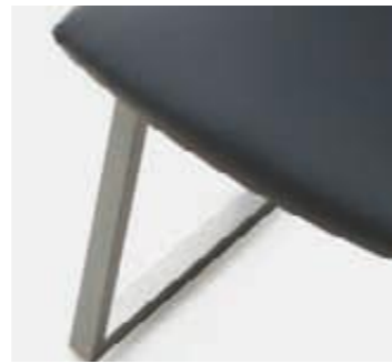
Estructura bicapa Structure bicouche Double painted structure