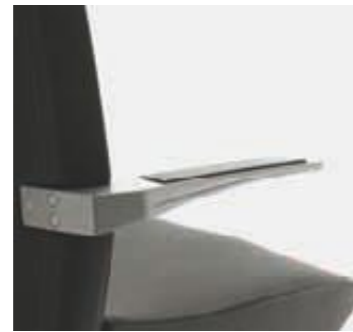
Brazos de aluminio bicapa Accoudoirs en aluminium bicouche Aluminium double painted armrest