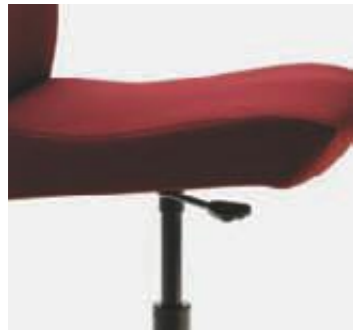
Elevación a gas Réglage à gaz Gas adjustment