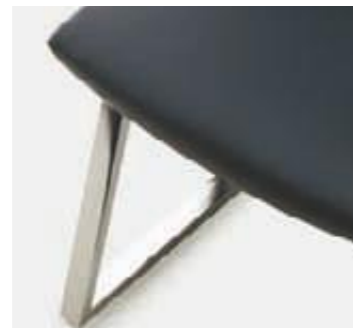
Estructura cromada Structure chromée Chrome structure