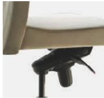
Sistema sincro Système synchro Synchro system