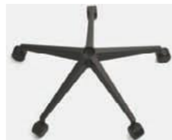
Base piramidal de poliamida Piètement pyramidale en polyamide Pyramidal polyamide frame