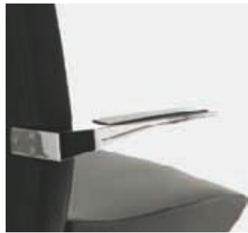
Brazos de aluminio cromados Accoudoirs en aluminium chromés Aluminium chrome armrest